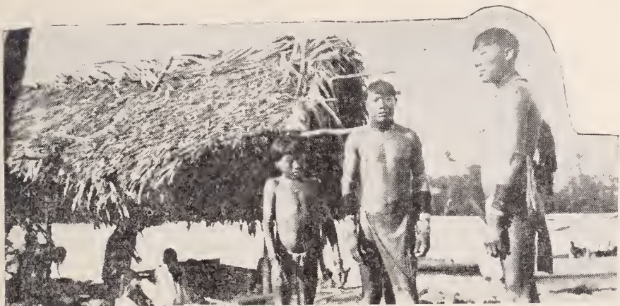
Auténticos tipos de las Bocas del Orinoco con sus atavíos, propios de los varones. Nos dice el Misionero: Hoy ya casi ni se usan.